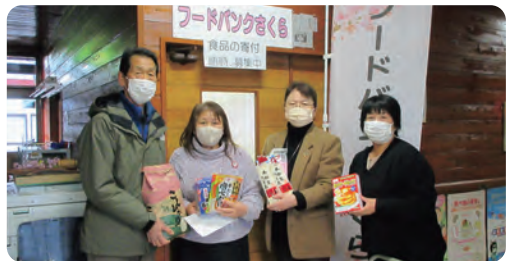
●JAしおのや女性部会様