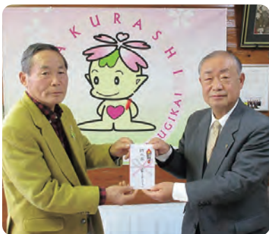
●氏家ロータリークラブ様(助成金)