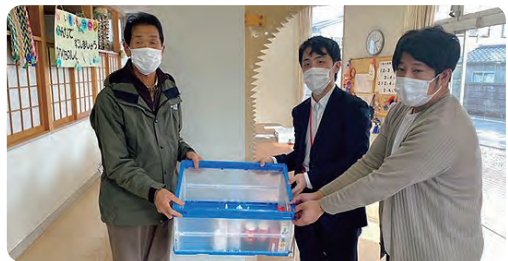
●ドコモショップさくら店様