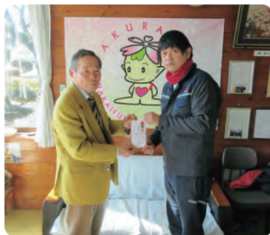
●三菱ふそう労働組合 本社支部様