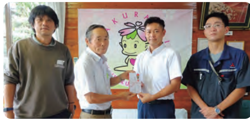
●三菱ふそう 労働組合 本社支部様