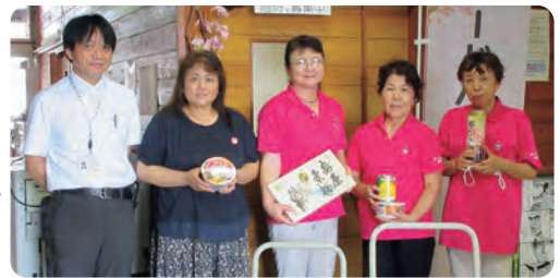
●JAしおのや 女性会様