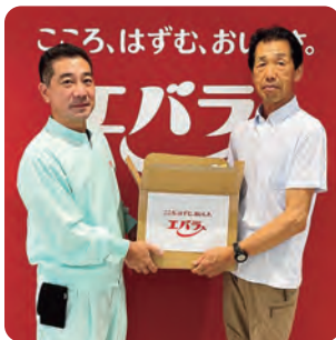
●エバラ食品工業株式会社 栃木工場様