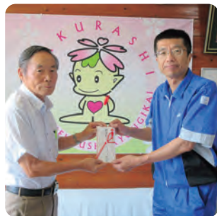
●ニッカウヰスキー(株) 栃木工場様