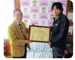
●三菱ふそう労働組合本社支部 様