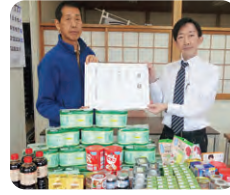
●株式会社ダイナム 様